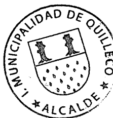
JAIME QUILODRÁN ACUÑA ALCALDE