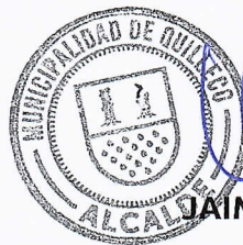
JAIME QUILODRÁN ACUÑA ALCALDE