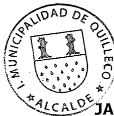
JAIME QUILODRÁN ACUÑA ALCALDE