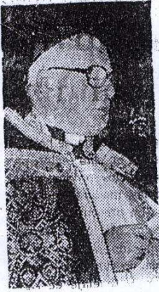
Monseñor Juan Francisco Fresno, cardenal arzobispo de Santiago.